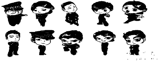
图1.“平安肇庆”微博卡通肖像

“请注意,您开的不是大黄蜂,请勿酒后驾车!”在2011年公安机关严打酒驾行为和《变形金刚3》电影热播之际,@平安南粤发布了网友绘制的大黄蜂漫画,提醒不要酒驾。数小时内,微博转发数就突破1500次。有人乘机调侃“喝了酒,就能开大黄蜂吗?”@平安南粤迅速回应“绝对不行!除非你一心想变形。”一句幽默话巧妙地化解了尴尬。